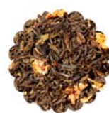
TES E INFUSIONES